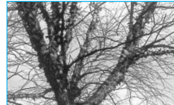
Rembrandtpark ... Betula nigra, een berk met 'haar' op z'n armen

De daktuin, waar u nu arriveert, heeft een tuin waar ronde lijnen (dat hebben ze alle vier) gevormd worden door schitterende beukenhagen.