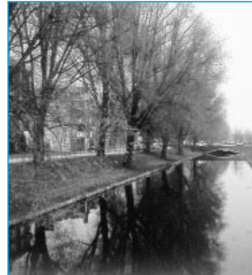
Wilgen langs spoorbaan

gemeenschappelijke binnenhof ontstond met een zogenaamde bedieningsstraat aan de schaduwkant van de blokken. Zo is het eerste woonhof of gemeenschappelijke binnentuin ontstaan waarna deze alsnog, in een aantal varianten, in de plannen van de tuinsteden werd opgenomen. In Slotervaart vindt u er enkele fraaie voorbeelden van. We komen ze op de route tegen en zullen ze zeker noemen.