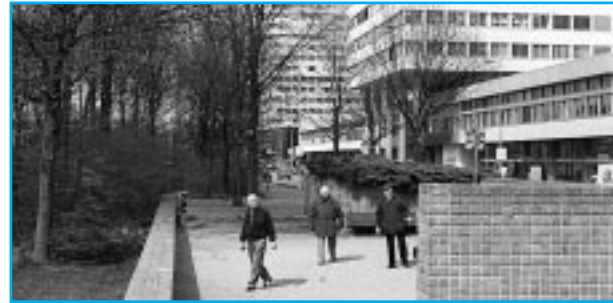
Jeu de Boules spelers. ... op enthousiaste wijze hun sport beoefenen ...

Als u hier het pad verder afloopt, komt u op een fietspad. Daar gaat u linksaf het park in. Honderd meter verder, over het bruggetje, staat aan de linkerkant van het pad een fraaie groep moerascypressen ( Taxodium distichum ), een conifeer die in de winter zijn naalden verliest. De bomen zijn tijdens de aanleg van het park in 1971 geplant. De bomen kunnen 40 tot 50 meter hoog worden,