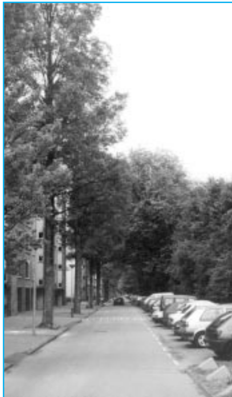
De Van Mourik Broekmanstraat

Deze bomenroute, die door een deel van Slotervaart loopt, is een uitgave van Stadsdeel Slotervaart, sector Stadsdeelwerken, afd. Beheer Openbare Ruimte.